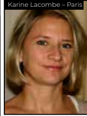
Karine Lacombe - Paris